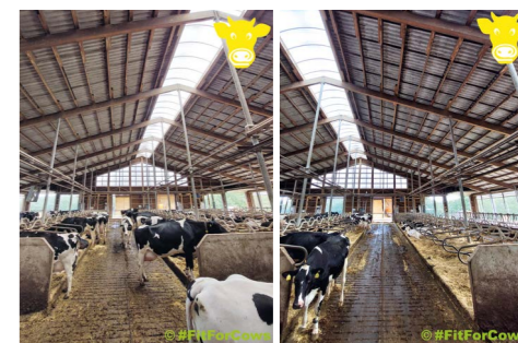
Stehen/Bunching bei Hitze