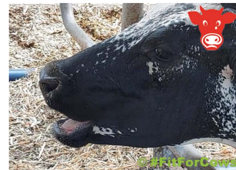
Maulatmung aufgrund von Hitzestress

Das Projekt ist Teil der Modell- und Demonstrationsvorhaben (MuD) Tierschutz im Bundesprogramm Nutztierhaltung (Förderkennzeichen 323-06.01-2820MDT140 und 323-06.01-2820MDT141).