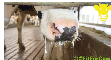
Vermehrtes Speicheln bei warmen Temperaturen